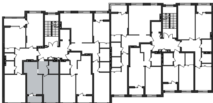
План-схема розташування квартири на поверсі