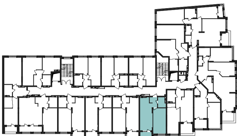
План-схема розташування квартири на поверсі